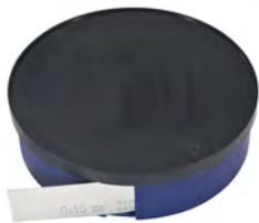
Breite 25 mm / width 25 mm