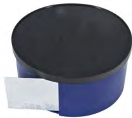
Breite 50 mm / width 50 mm