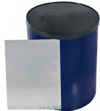
Breite 150 mm / width 150 mm