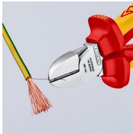
tiszta vágat a vágócsúcsokon, vékony Cu-huzaloknál is