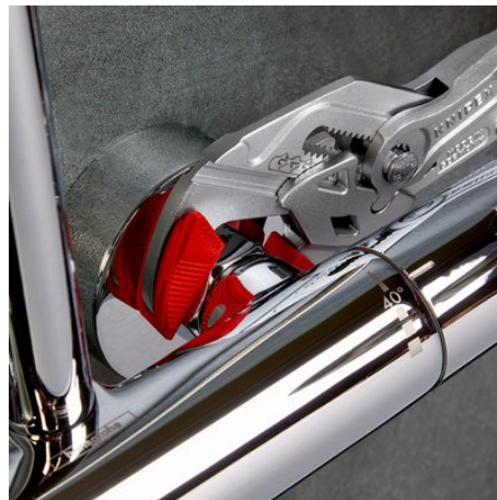
munkavégzés krómozott szerelvény a felület megrongálása nélkül