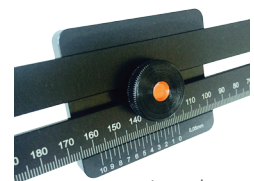
Nonius 1/20 mm reading 1 / 20 mm