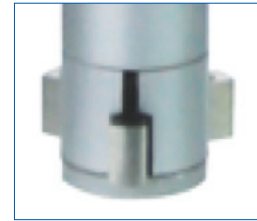
6 - 12 mm