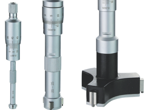
6 - 12 mm