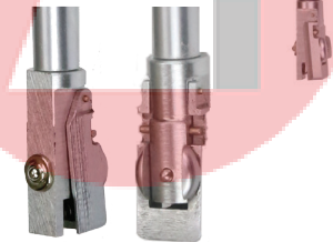
10 - 18