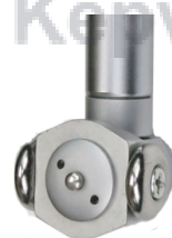
35 - 50 / 50-180