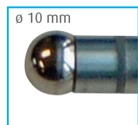
\phi 10 mm