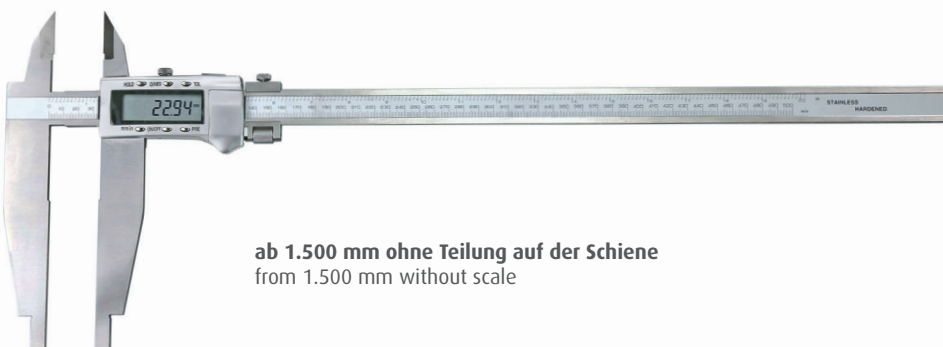
ab 1.500 mm ohne Teilung auf der Schiene from 1.500 mm without scale