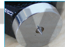
D: Kegel, 30 °, SR 0,1 mm Sharp cone point, 30°, SR 0,1 mm