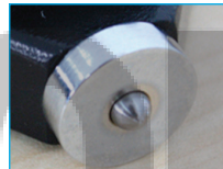
C: Kugel 2,5 mm Spherical 2,5 mm